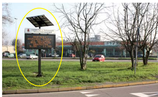
SANTA CORINNA davanti al Bazar