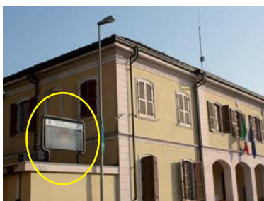
MAIRANO di fianco al Municipio