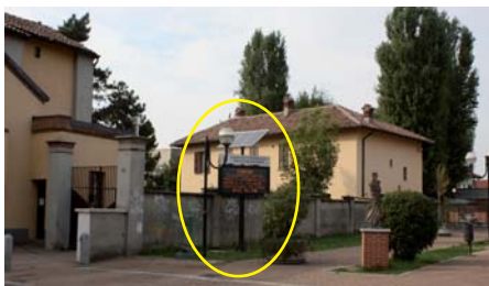
NOVIGLIO in Piazza 11 Settembre

La comunicazione attraverso i cinque tabelloni elettronici si affianca così agli altri strumenti utilizzati dal comune per informare la cittadinanza: il periodico Il Novigliese, il sito internet istituzionale www.comune.noviglio.mi.it e le bacheche.