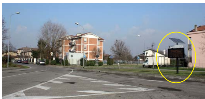
MAIRANO all'ingresso del centro abitato