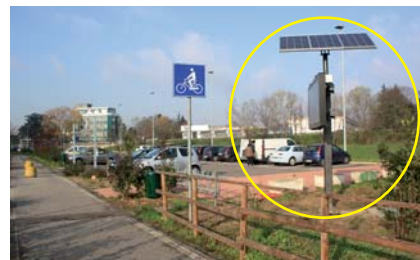
SANTA CORINNA davanti alla Farmacia