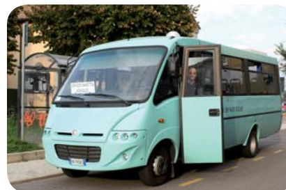
Gli orari e le soste della navetta sono esposti alle fermate dello scuolabus e consultabili sul sito internet: www.comune.noviglio.mi.it

Il servizio, per il momento, è sperimentale, ma non è detto che non diventi definitivo o addirittura possa essere implementato a seconda delle esigenze dei fruitori, a patto però che venga effettivamente utilizzato come ha spiegato l'assessore ai